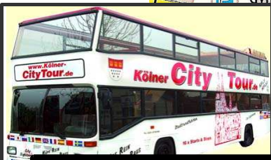
3 Départ CityTour