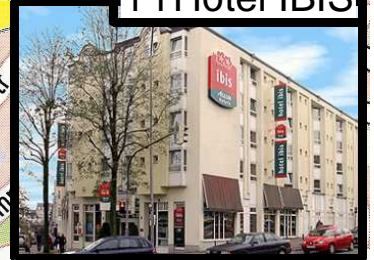
1 l'Hôtel IBIS