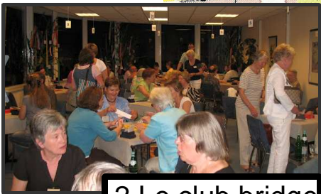
2 Le club bridge