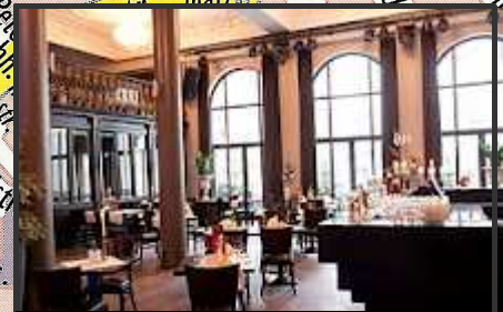
4 restaurant STAIRS